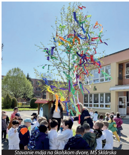
Stavanie mája na školskom dvore, MŠ Sklárska