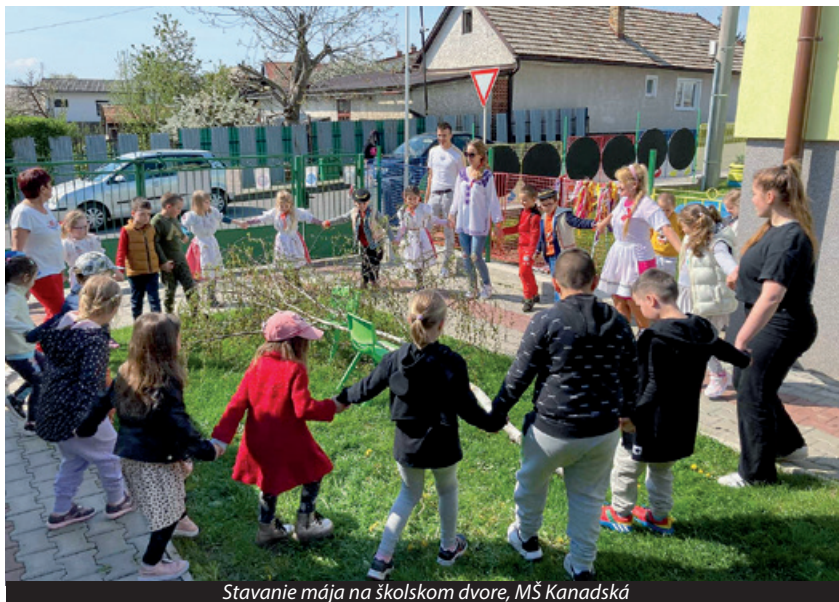
Stavanie mája na školskom dvore, MŠ Kanadská